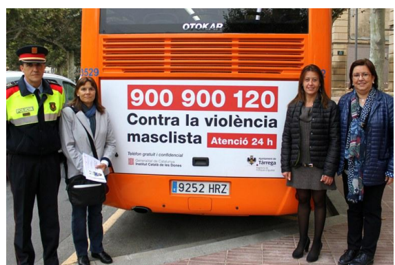
Retolació bus urbà (20 d'octubre)