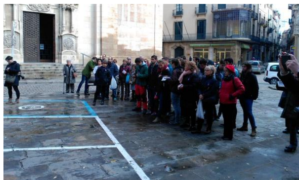
Lectura del manifest (21 de novembre)