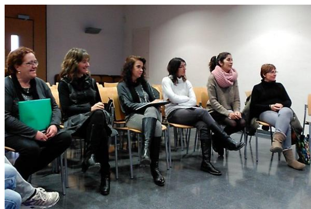
Curs Introducció a l'abordatge de la violència sexual (26 de novembre i 3, 10 i 17 de desembre)