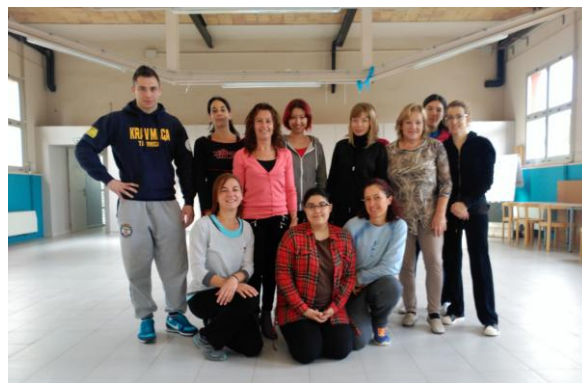
Taller de defensa personal: Krav Maga (24 i 31 d'octubre i 7 de novembre)