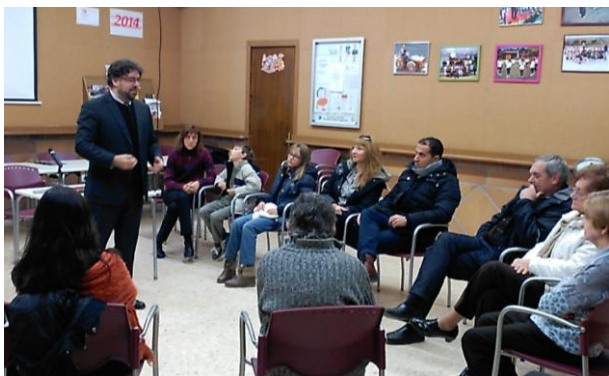
Conferència Por en silenci: la violència de gènere al llarg de la història (22 de novembre, Santa Maria de Montmagastrell)