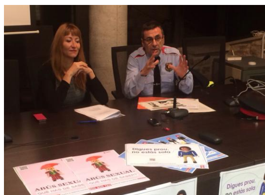
Conferència La violència de gènere: com identificar-la i prevenir-la (18 de novembre, El Talladell)