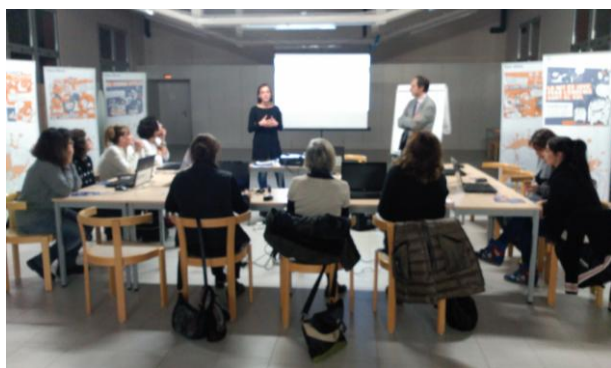
Escola de famílies: Taller pràctic sobre control parental a les xarxes socials (19 de novembre)