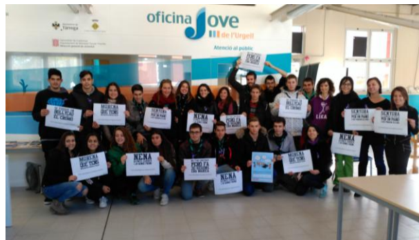
Acció al carrer (21 de novembre)