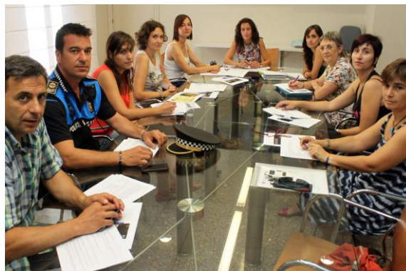
Reunió Grup d'experts/es (28 d'agost)