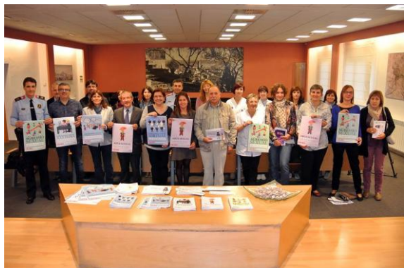
Presentació de la Campanya (20 d'octubre)