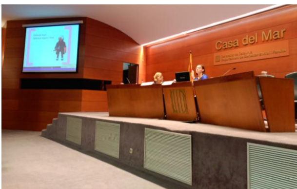
Presentació de la Campanya Digues prou, no estàs sola dins la jornada Reconeguem les violències sexuals. Jornada de reflexió i debat (23 de novembre)