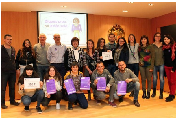
Liurament de premis II Concurs de lip dub (25 de novembre)