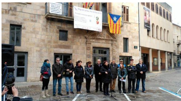
Lectura del manifest (21 de novembre)