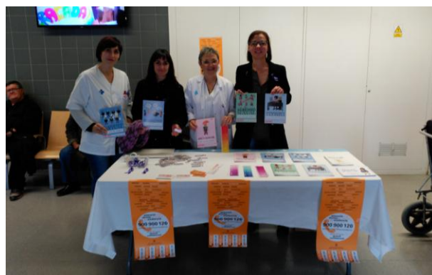
Taula informativa CAP Tàrrrega (25 de novembre)