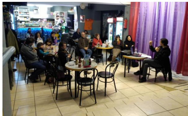
Conferència Dones de la història targarina del segle XX: quatre exemples (24 de novembre, El Talladell)